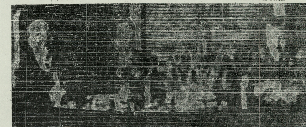
La Junta Militar informó a la ciudadanía por cadena de emisoras y de televisión, las razones por las cuales asumió el mando de la República. De izquierda a derecha, el Comandante en Jefe de la Armada, contralmirante José Toribio Merino; Comandante en Jefe de la Fuerza Aérea, general Gustavo Leigh; Comandante en Jefe del Ejército, general Augusto Pinochet; y Director del Cuerpo de Carabineros, general César Mendoza.