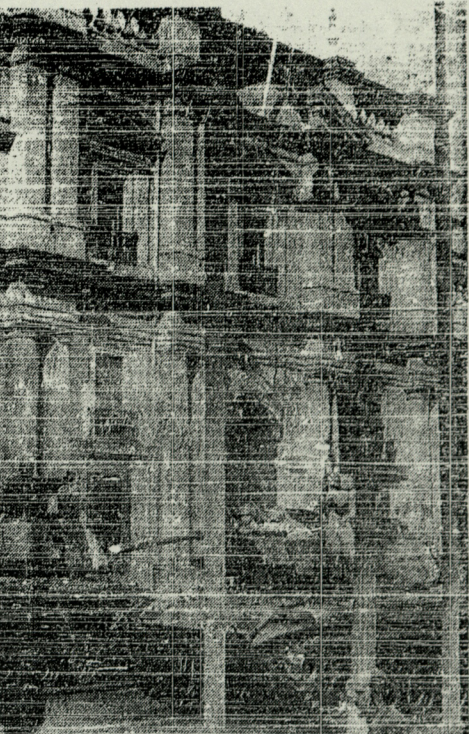
Dos tanques accionaron permanentemente junto a La Moneda, por la Plaza de la Constitución, antes y después del bombardeo efectuado por la FACh.

ca y patriótica en defensa de los altos intereses de la patria, ha permitido con su oportuna información controlar y destruir importantes núcleos extremistas y tener actualizado el cuadro de los extremistas y extranjeros subversivos residentes, para limpiar nuestro país de elementos indeseables que nada tienen que ver con nuestra tierra y orizan común. 2.— Las patrulleras de Investigaciones tendrán libre paso por la ciudad, sin perjuicio de la identificación profesional de sus ocupantes si las circunstancias lo hacen necesario, ya que este cuerpo está cooperando con todos sus miembros en estrecha colaboración con las FF. AA. y Carabineros. 3.— Las ambulancias y Cuerpo de Bomberos tendrán libre tránsito sin perjuicio de los registros que estimen convenientes los controles militares. (Fto.) Junta de Gobierno.