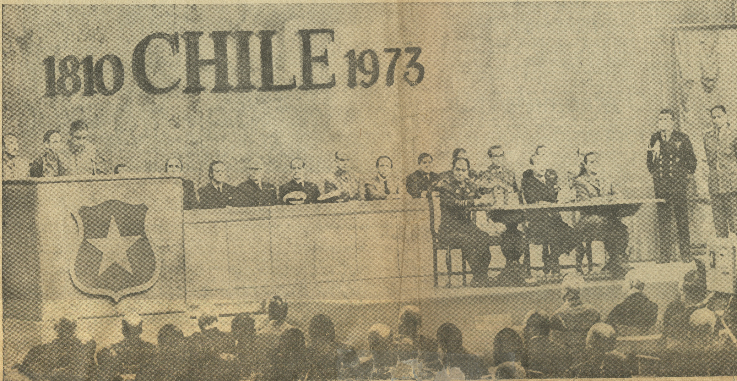
En solemne ceremonia se dirige al país el Presidente de la Junta de Gobierno, general Augusto Pinochet, quien destacó el imperio de la unidad nacional para la reconstrucción nacional. En el grabado aparecen, además del general Pinochet, que habla (a la izquierda), los restantes miembros de la Junta y los Ministros de Estado

En solemne ceremonia, que impresionó por su sobria majestuosidad, el Presidente de la Junta de Gobierno, general Augusto Pinochet, dirigió un mensaje a la nación al cumplir un mes del pronunciamiento de las Fuerzas Armadas y Carabineros, proclamando en su discurso "la unidad nacional como la aspiración más preciada y sólida para la recuperación de Chile".