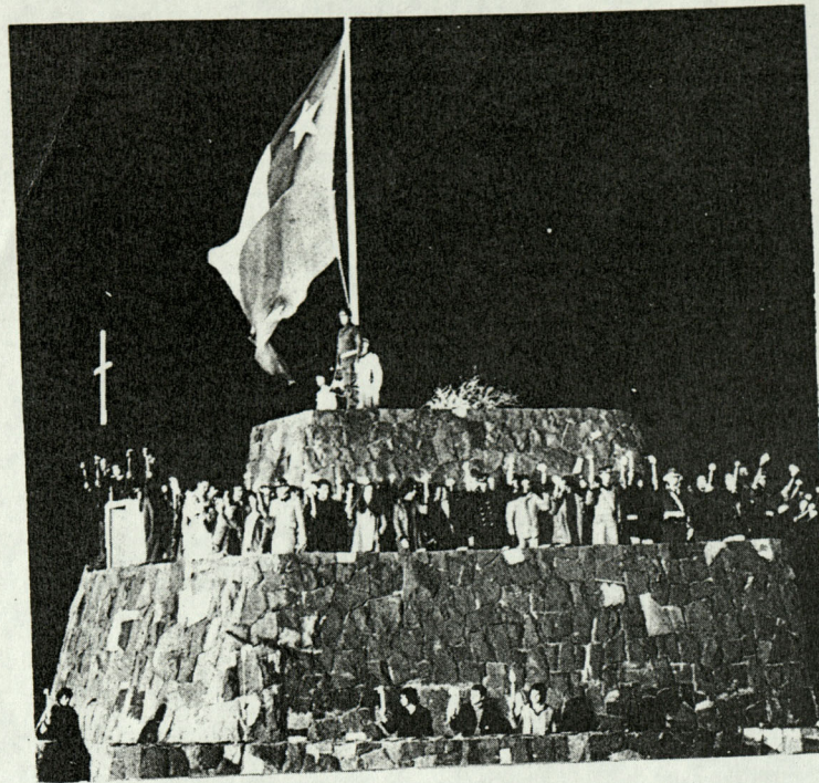
CARACTERISTICAS DE GRAN EMOCION tuvo la reunión de la juventud con el Presidente de la República en el Cerro Chacarillas.