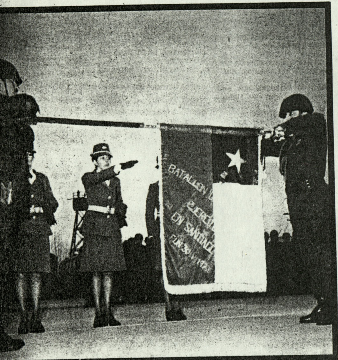
EL JURAMENTO A LA BANDERA en las unidades militares de todo el país tuvo características de gran emoción y patriotismo. La fotocolor muestra a tres subtenientes del Comando de Apoyo Administrativo del Ejército jurando en el Batallón de Transportes N° 1, que comanda el teniente coronel Pedro Howard. AL LADO, Universidad Católica se impuso, sorpresivamente, a Palestino. En la foto, Hernández disputa un centro en el área rival. El balón es despejado entre Elias y Hodge.