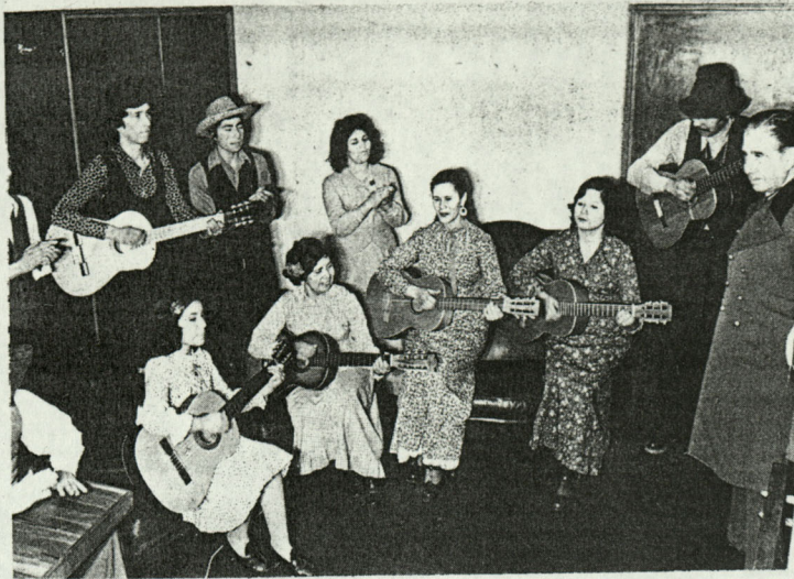
UN ESQUINAZO AL PRIMER MANDATARIO, Augusto Pinochet Ugarte, con motivo del Día Nacional de la Juventud, ofreció el Conjunto Folklórico "El Llano de Maisa" en el Gabinete presidencial del edificio Diego Portales.

"No ignoro que se levantarán muchos escollos, ambiciones y personalismos, que pretenderán impedir nuestra marcha y hacernos volver hacia atrás, donde sólo nos esperarían las penumbras de la esclavitud.