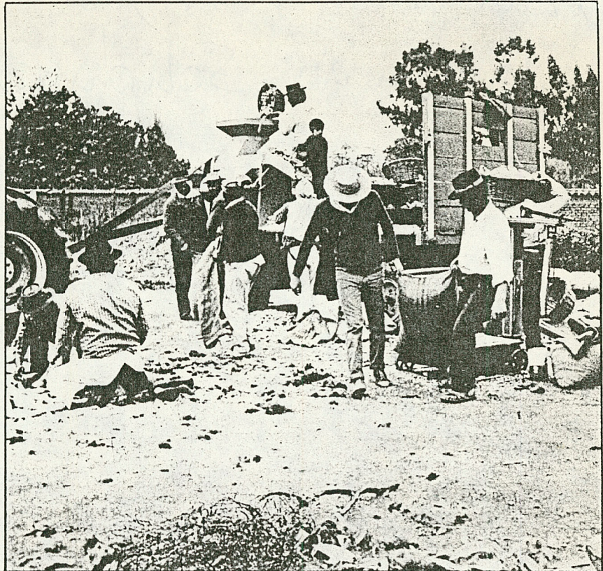
Los que quedan sin tierras ¿pierden además sus derechos laborales?