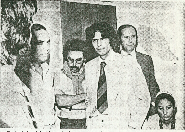
Parte de los detenidos, mientras permanecían en el cuartel de Investigaciones.

Tribunales de Justicia rechazó los recursos de amparo interpuestos en