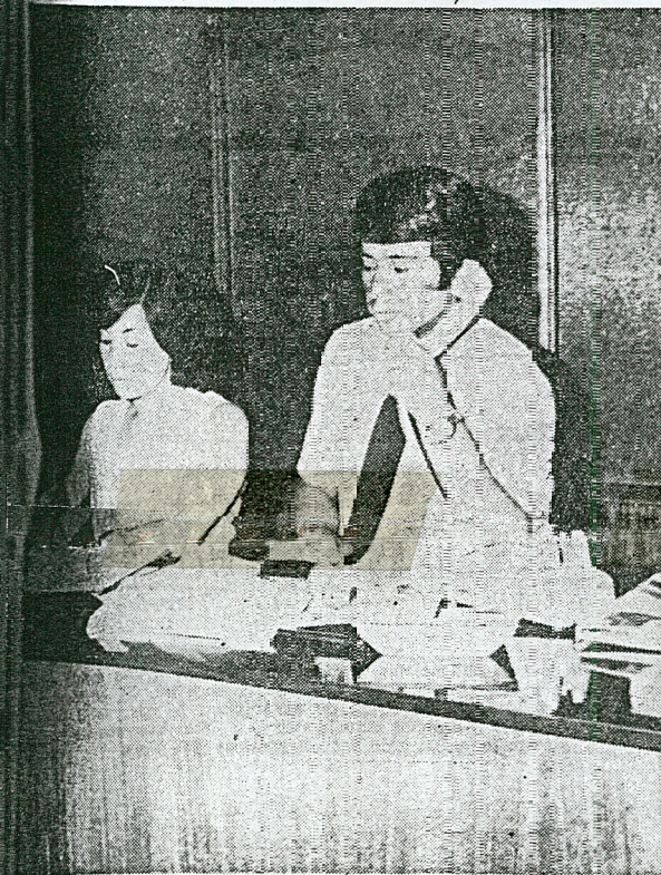
La recepción ágil, expeditiva, atenta encuentra al visitante de ODEPLAN