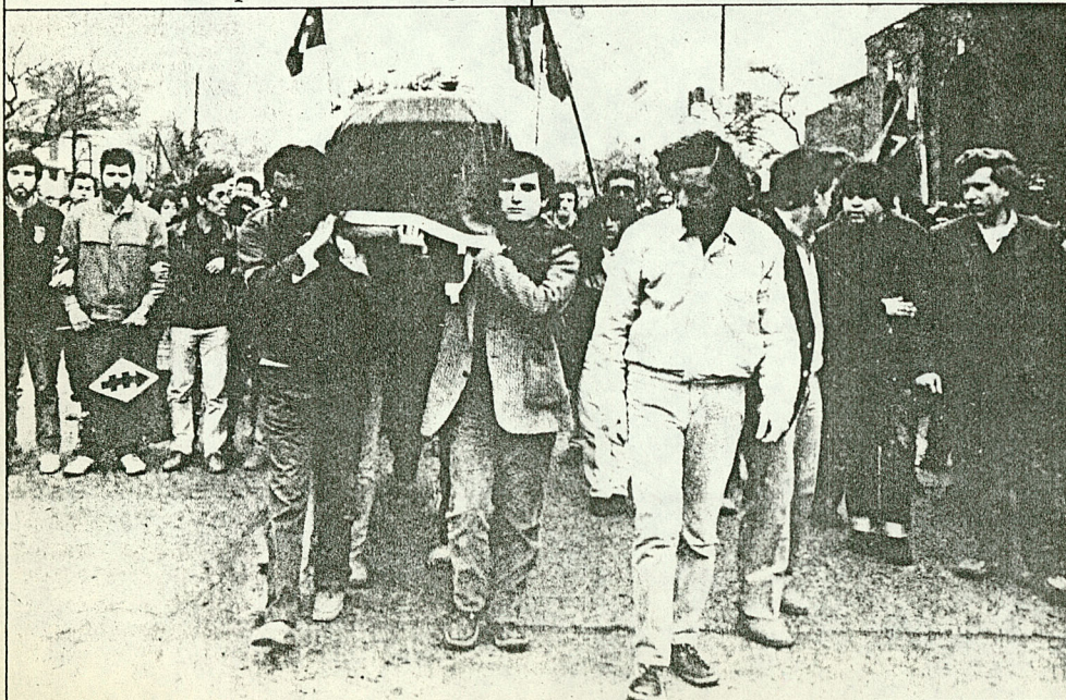
Sus amigos y compañeros están convencidos que se trata de un crimen político selectivo.

Aunque muchas veces bajo la Dictadura se había sancionado y expulsado estudiantes en la Usach, este Sumario es considerado un hito. Destaca por la masividad y la selectividad: se intentó descabezar totalmente el movimiento estudiantil que durante 1985 mostró fuerza movilizadora y capacidad organizativa, a pesar de la permanente represión. La acción desplegada y la constitución de la Federación en noviembre fue vista, sin dudas, como un peligro dema-