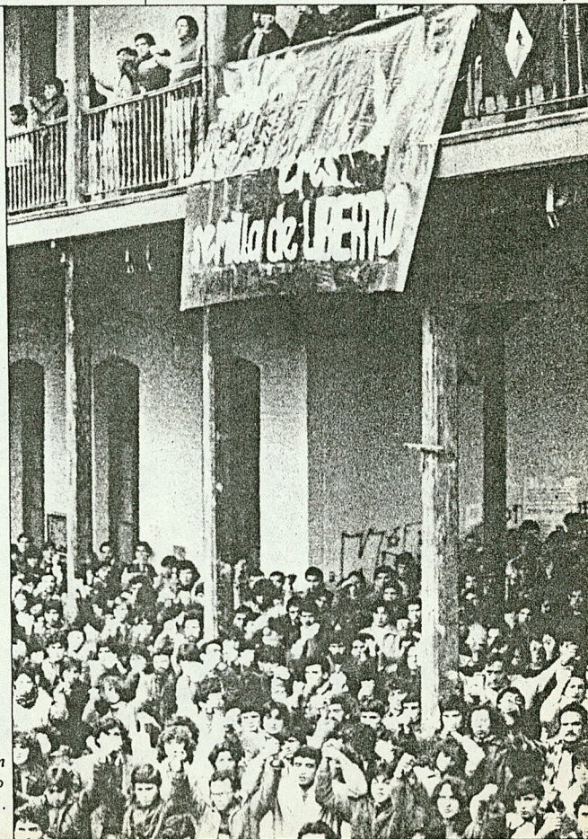
Manifestaciones estudiantiles en la Usach, protestando por el asesinato del dirigente.

El informe continúa dando cuenta de una marcha, tras la cual "se produce