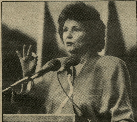
Lucía Hiriart de Pinochet.

Lucía Hiriart —al recibir un homenaje en el Salón de Honor de la Municipalidad— junto con afirmar que continuará su labor solidaria como esposa del comandante en jefe del Ejército, expresó también su tristeza ante la idea de entregar a la próxima Primera Dama, Leonor Oyarzún de Aylwin, la Fundación Nacional de Ayuda a la Comunidad (Funaco).