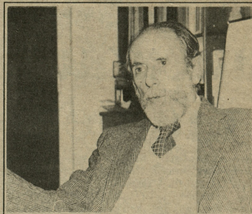
Andrés Aylwin dio sus razones para que el Congreso no se instale en Pancho

Dice que Valparaíso puede estar seguro de contar con el futuro Parlamento para proyectos serios en favor de la región, pero que no se pue-