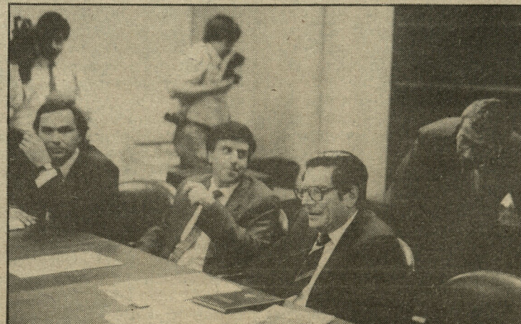
Un aspecto del encuentro que duró más de dos horas.

tará la labor de los legisladores sobre los proyectos enviados al Parlamento de abolición de la pena de muerte, conductas terroristas y modificaciones a los códigos de Justicia Militar, Penal y de Aeronáutica, porque "tenemos que tener la serenidad suficiente para no entrar en el juego de estos actos extremistas