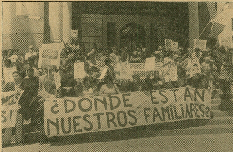
Ayer en el Congreso se realizó una manifestación en favor de la libertad de los presos políticos.

Sostuvo que "puede haber distintos criterios y posiciones, que serán