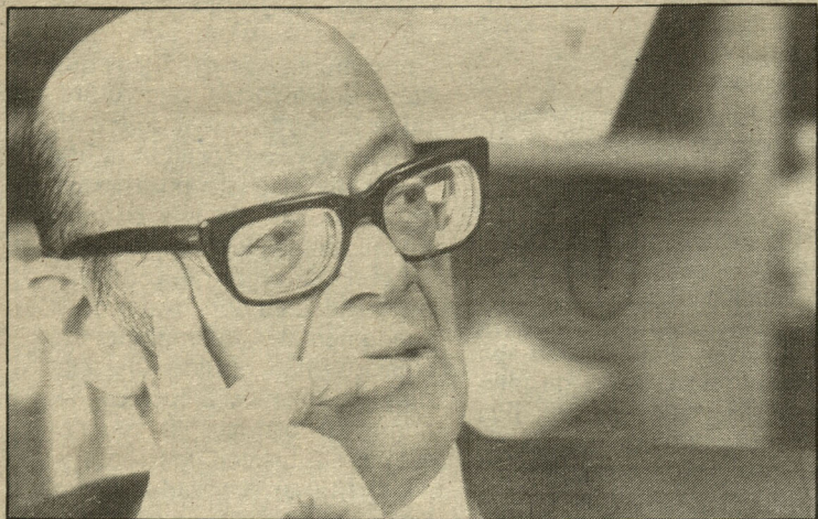
El jurista seguirá vinculado a labores en defensa de los derechos humanos.

Puntualizó que en el Informe "se describen los hechos, el momento