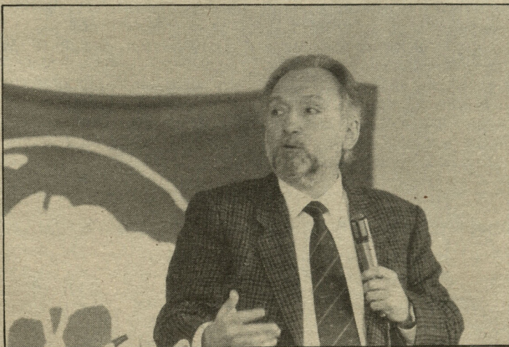
Arrate expresó que el Poder Judicial no tuvo fortaleza para proteger derechos de las personas.

"Deseo públicamente expresar mi reconocimiento a la grandeza moral y hombría de Andrés Allamand, quien formuló declaraciones en las que reconoció responsabilidades