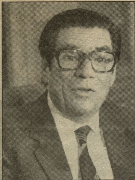
Francisco Cumplido, ministro de Justicia.