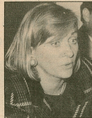
Evelyn Matthei: "Salvar a Arica es un problema de todo Chile".

"Es muy lamentable que temas que todo el mundo ha analizado y cuyas soluciones se comparten, sean dejados de lado. Hemos peleado duramente en la Cámara y en el Senado por rebajar siquiera el arancel del 9 al 6 por ciento; pero eso no va a ser suficiente. La solución concreta es eliminarlo", puntualizó la diputada Evelyn Matthei.