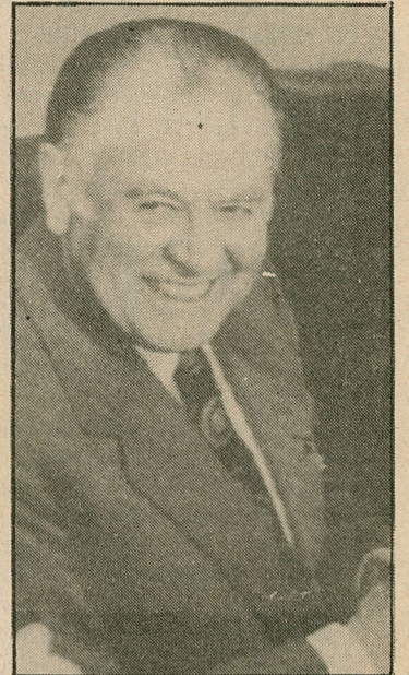
Presidente Patricio Aylwin.

Tras apuntar que los programas militares de Chile están encaminados sólo a mantener su poder defensivo y disuasivo, y que las relaciones entre las Fuerzas Armadas chilenas y argentinas pasan por un momento óptimo, Aylwin dijo que Chile "no tiene ningún programa para desarrollar armamento nuclear o químico".