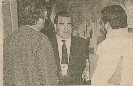
El senador Eduardo Frei conversa con algunos militantes

mento eclesial se adaptaron párrafos textuales. Porque —como afirmó un vicepresidente DC— "nuestra doctrina no cambia. Sólo podemos adecuar algunos aspectos de nuestra ideología a los tiempos actuales, pero la filosofía sigue siendo la misma".