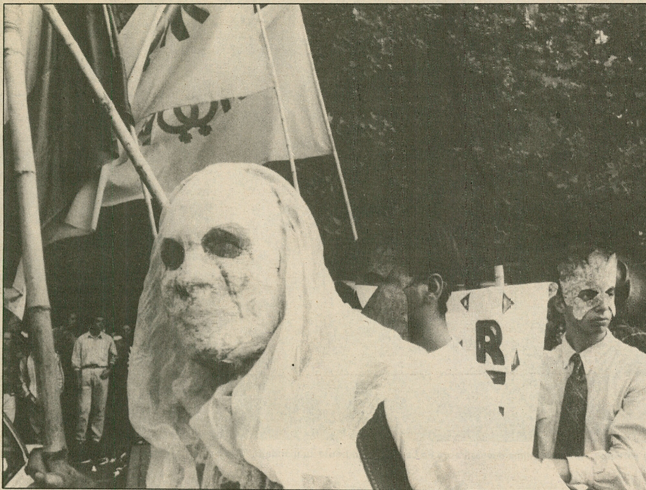
Un aspecto de la marcha que más de dos mil personas protagonizaron por la Alameda.