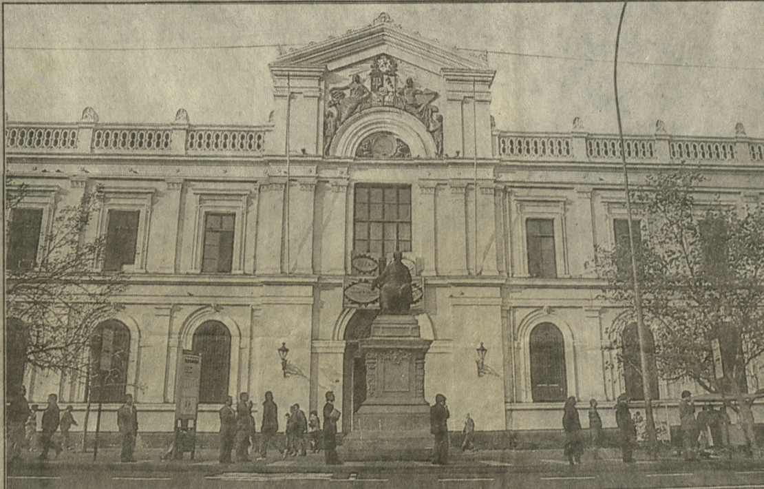
U. de Chile: hasta los de la Católica a Internet, pasándolos como propios.

¿O sea que los que ya no adhiere al Gobierno y se pasaron a la oposición es porque según la propia autoridad ésta no logra reformar la Constitución, porque los opositores se oponen? Se está pasando Binbo. ■