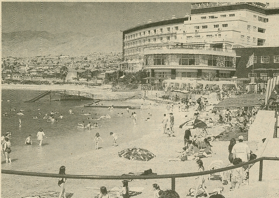
"Playa Club", una de las mejores de Antofagasta, cobra entrada.

Es su concesionaria desde hace ocho años.