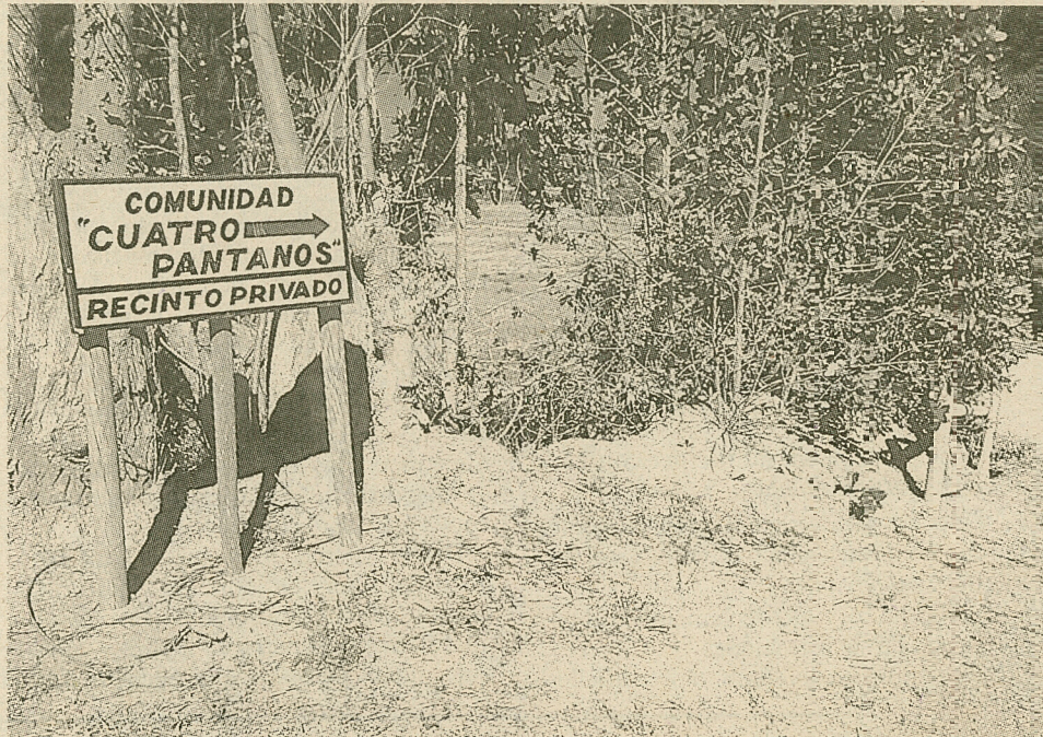
En Vichuquén un letrero ahuyenta a los bañistas. Los dueños del terreno no contravienen la ley. Este es un lago pequeño.

Esta situación promete cambiar con el nuevo reglamento del Ministerio de Bienes Nacionales, firmado el viernes último por el Presidente de la Repúbli-