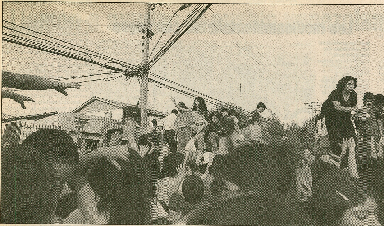
"Dame", "dame", pedían los asistentes a los organizadores del acto que entregaban colaciones.