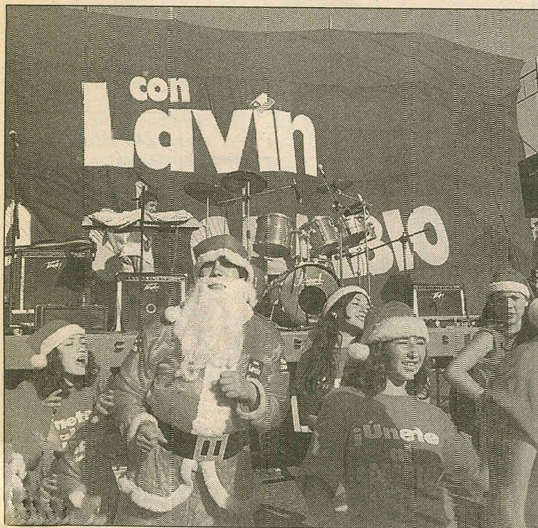
ejitas pascueros, la expectativa de regalos y de colaciones atraen a los sus padres.

Ante la aglomeración, el comando -para evitar eventuales accidentes- optó finalmente por cancelar la entrega de los ansiados regalos, que quedaron guardados en un negocio cercano. Algunos de los obsequios eran pelotas de plástico, según se pudo apreciar. Los asistentes comenzaron a retirarse pasadas las 20:30.