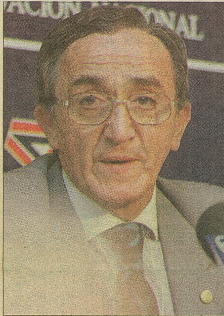
El diputado RN Francisco Bayo.

En lo relativo a la vida partidaria asegura que seguirá vinculado a su colectividad, "luchando por la unidad del partido" y que no descarta una repostulación. Pero, por el momento, está más interesa-