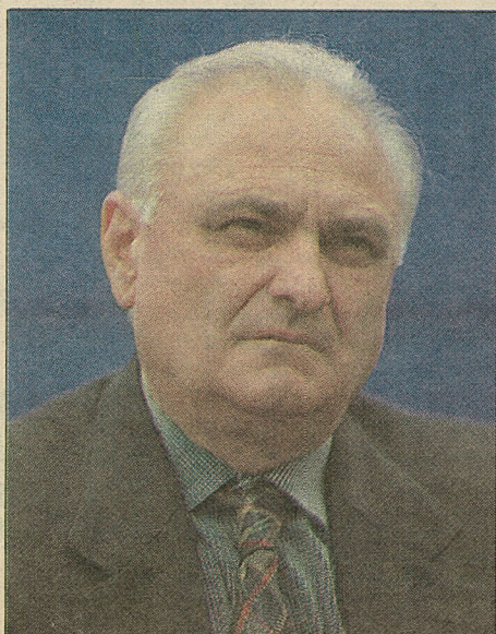
El diputado RN Angel Fantuzzi.

Respecto de una futura repostulación, el diputado no se arriesga a negarse a la posibilidad. "Decir no, no conviene, pero es improbable que vuelva a asumir un desafío de este tipo, porque estoy consciente de que hay gente más joven, con más entusiasmo y capacidad que yo".