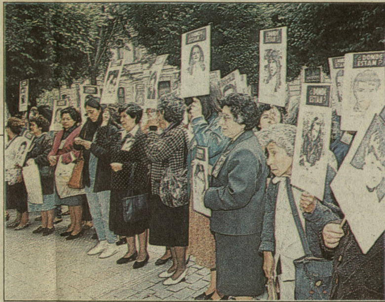
Hubo un Informe Rettig y algunas condenas, pero el general supo negociar para impedir el enjuiciamiento masivo de los uniformados por violaciones a los derechos humanos.

Pinochet terminó su periodo en 1989 con saludables cifras macroeconómicas, lo cual le ha permitido a los dos gobiernos democráticos de la Concerta-