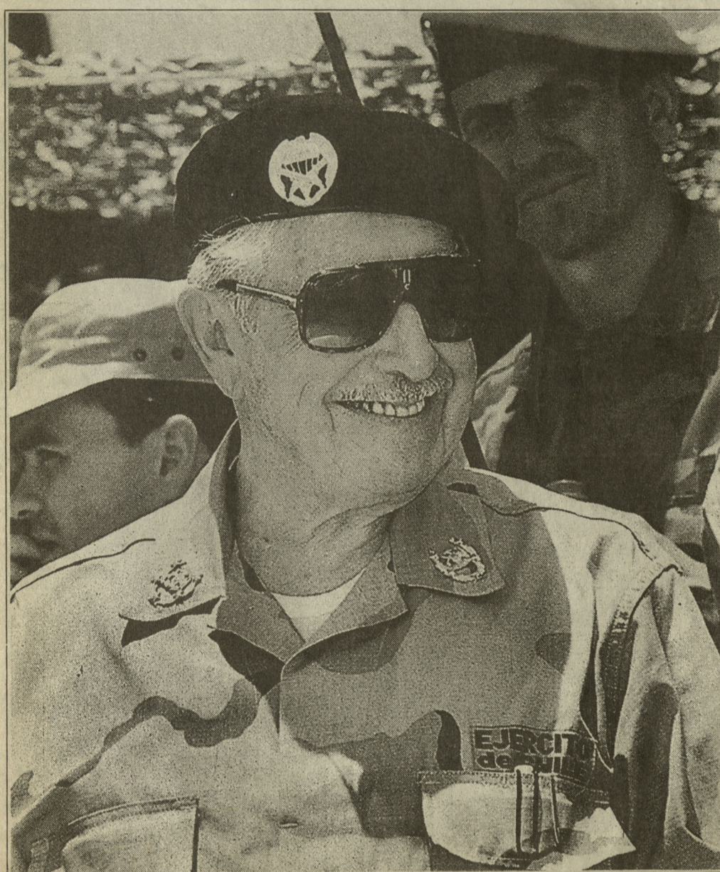
A los 82 años el general enfrenta su última batalla: asumir como senador y cumplir así la última disposición transitoria de su Constitución.

Ese mismo año, 1978, se convierte en el jefe indiscutido cuando obtiene el apoyo del almirante y del general director