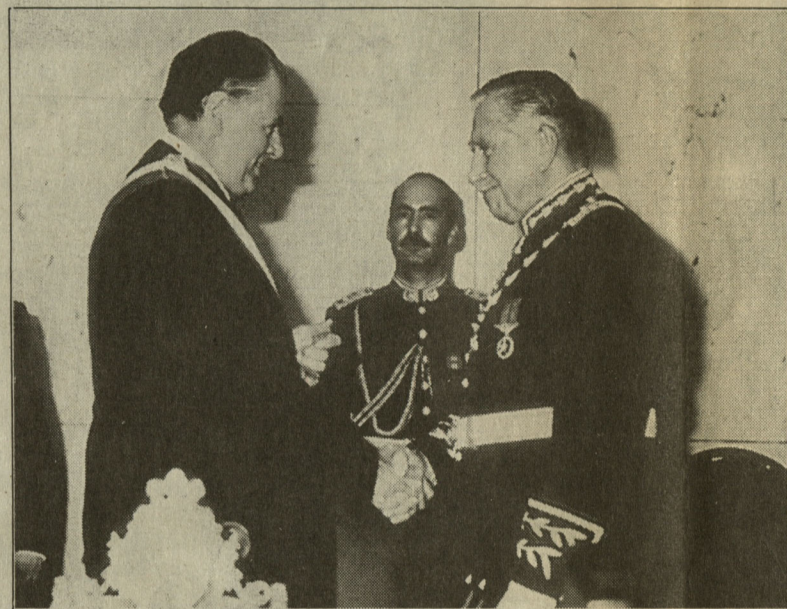
El general entregó el mando presidencial, en marzo de 1990, al opositor Patricio Aylwin. La subordinación al poder político fue tensa y Pinochet le recordó en dos ocasiones su posición con "ruido de sables".

El general se convirtió en un símbolo histórico de odios —como el atentado con cohetes que sufrió el 86 del que salió ileso— y amores —muchos rusos pedían "un Pinochet" para ordenar el país después del comunismo—. La represión de los primeros días —que los militares consideraron una guerra interna contra los grupos armados que salvó al país después del comunismo—, imagen con anteojos oscuros contribuyeron a que la prensa internacional lo presentara como un dictador siniestro ante el mundo. El aislamiento internacional no tardó en llegar, dificultándole sus viajes al exterior, más aún después de sufrir su peor humillación de manos del dictador Ferdinand Marcos, quien le canceló la invitación cuando ya iba en vuelo a Manila.