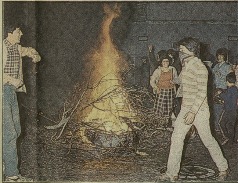
Durante las protestas de 1983, gatilladas por la crisis económica, el general permitió a Jarpa el diálogo con la oposición para una solución negociada. Pero después cerró el puño, clausuró la apertura y retomó el itinerario establecido en la Constitución.

ción mantener el ritmo de crecimiento positivo, el que ya se prolonga por 14 años.