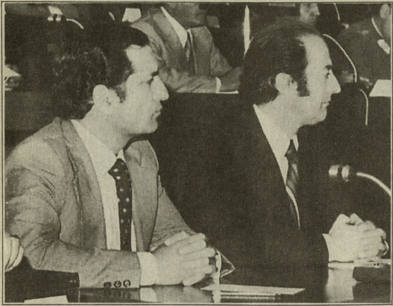
El ex Presidente depositó su confianza en un grupo de jóvenes economistas, liderados por Sergio de Castro y Pablo Baraona, a quienes dejó hacer una profunda transformación económica y social.

La nueva Carta Fundamental es aprobada por el 67 por ciento en el plebiscito de 1980 y en marzo del año siguiente, ya como Presidente constitucional, se trasladó a La Moneda. Allí asumía un nuevo rango, el de capitán general, título que desaparecerá cuando abandone después de 64 años el Ejército, que mantuvo siempre cohesionado.