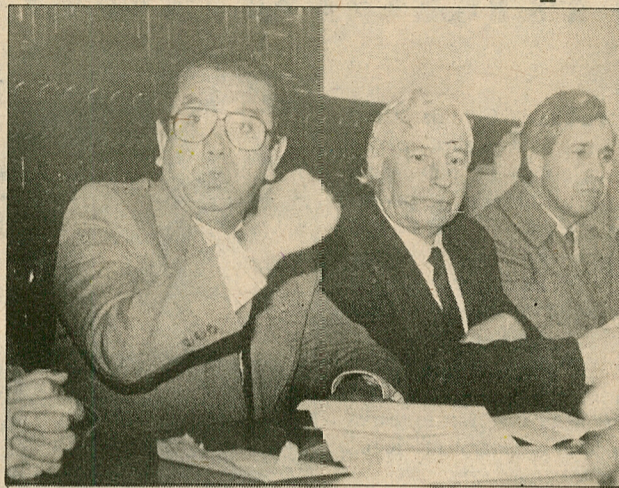
Diputado Roberto Muñoz Barra, presidente de la Social Democracia

Añadió que el ingreso familiar promedio en el país sigue siendo muy bajo para soportar gastos de esos grupos familiares y que es urgente que la