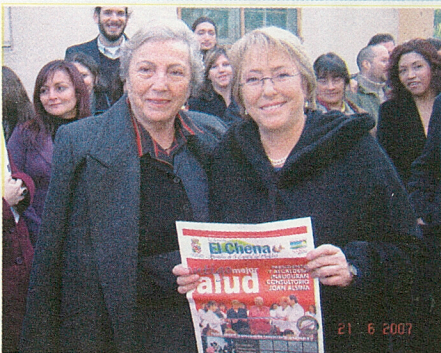
"Yo leo El Chena", expreso La Presidenta