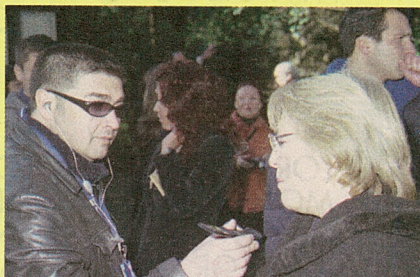
La Presidenta en entrevista exclusiva con Radio San Bernardo 102.9FM

en el centro se lleva a cabo. El compromiso se expresa además de forma concreta a través del convenio CONACE-FONASA-MINSAL. En la ocasión la Mandataria fue entrevistada en exclusiva por Radio San Bernardo y leyó junto a la Alcaldesa los contenidos del Periódico Comunal El Chena.