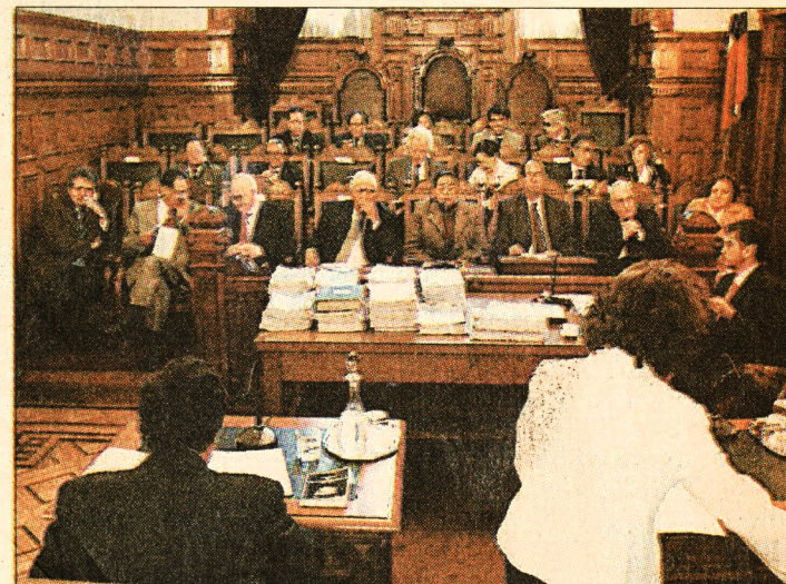
INDEPENDENCIA.— Los ministros de la Corte capitalina coinciden en que cada juez debe ser independiente a la hora de zanjar si aplica o no la amnistía.

Laura Soto, en tanto, rechazó las declaraciones del presidente de la Corte Suprema Enrique Tapia, quien dijo que los tribunales deberán resolver "caso a caso" la aplicación de la Ley de Amnistía. La diputada afirmó que la resolución del tribunal internacional "es vinculante" y el gobierno debe aceptar totalmente este fallo y adecuar la legislación chilena a eso.